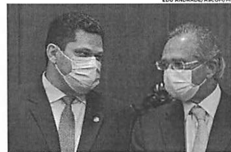
A primeira parte da reforma tributária foi entregue no dia 21 de junho de 2020, pelo ministro Paulo Guedes ao então presidente do Senado, Davi Alcolumbre

O ministro da Economia, Paulo Guedes, fará pessoalmente, nesta sexta-feira (25), a entrega ao presidente da Câmara dos Deputados, Arthur Lira (PP-AL), da segunda fase da proposta do governo federal para a Reforma Tributária. O novo Projeto de Lei do governo trata da Reforma do Imposto de Renda para Pessoas Físicas, para Empresas e Investimentos. A assessoria do ministro anunciou que Guedes irá acompanhado da Secretaria de Governo, Flávia Aruda, e do secretário especial da Receita Federal, José Tostes. O evento está marcado para as 9 horas. A primeira parte da reforma tributária do governo foi entregue ao Congresso há exato um ano - no dia 21 de junho de 2020. O projeto também foi entregue