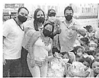
Voluntários da Fribal com alunos e a Diretora da escola Nossa Senhora de Fátima comemorando os novos materiais escolares

*** Esse ano a ação social da Fribal beneficiou alunos da Escola Nossa Senhora de Fátima, localizada na Vila Embretel e que atende crianças na faixa etária de quatro a cinco anos de idade, além de alunos da Escola Eney Santana, mantida pela APAE São Luís.