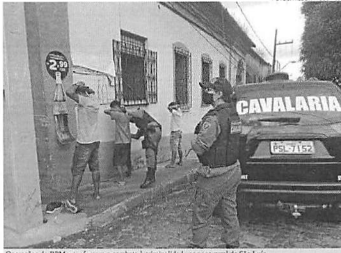
Operações do RPMont reforçam o combate à criminalidade na zona rural de São Luís